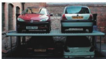
Plataforma en funcionamiento